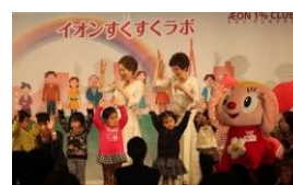
イオン すくすくラボ

* 活動の詳しい内容はこちら ( https://www.aeon.info/1p/ ) をご覧ください。