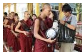
ミャンマーで托鉢体験