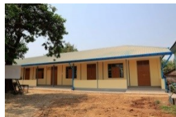
ミャンマー新校舎