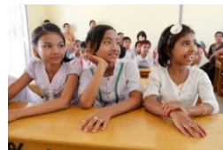
新校舎に喜ぶ子どもたち