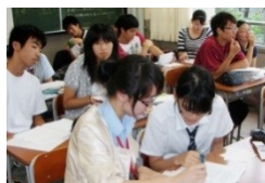
中国での授業体験