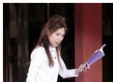
イオン ふるさと発見伝