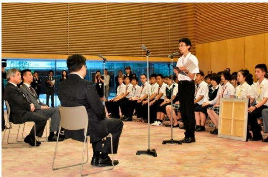
首相官邸を表敬訪問