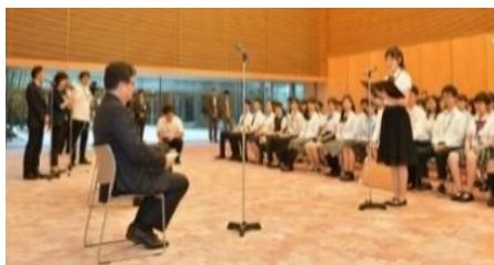
首相官邸表敬訪問