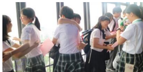
対面を喜ぶ日中の高校生ペア

* 活動の詳細内容はこちら ( https://aeon1p.com/ ) をご覧ください。