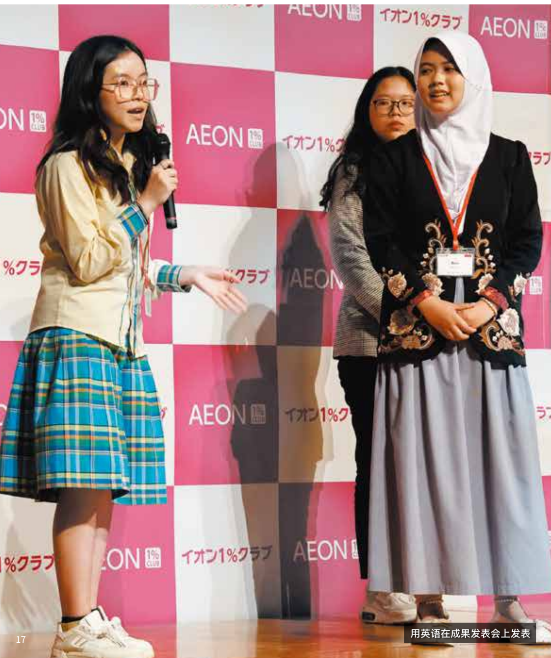
用英语在成果发表会上发表