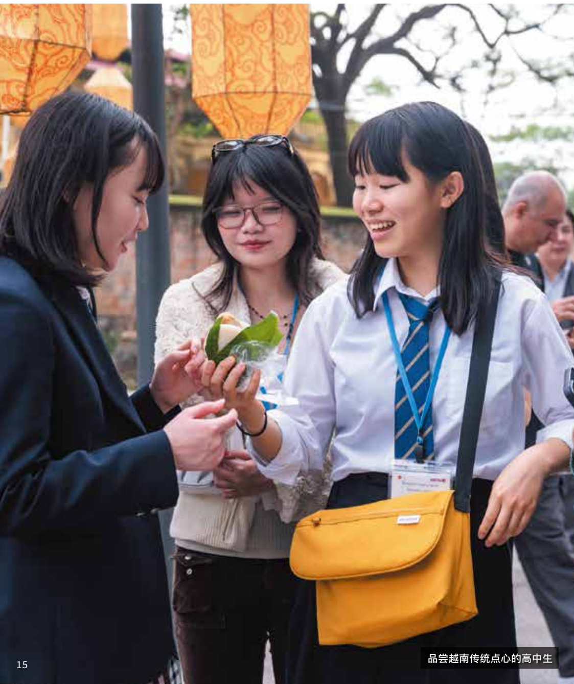
品尝越南传统点心的高中生