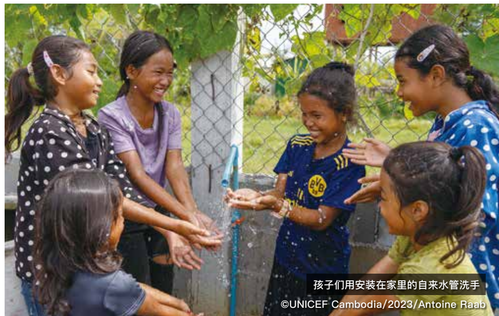
孩子们用安装在家里的自来水管洗手