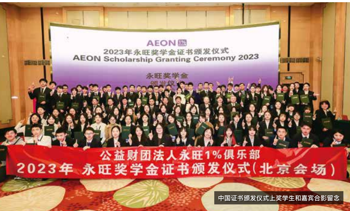
中国证书颁发仪式上奖学生和嘉宾合影留念

永旺奖学金是为亚洲大学生提供的奖学金，希望他们未来在日本与祖国之间架起友好的桥梁。永旺奖学金向在日本的大学留学的奖学生提供学费和部分生活费，同时也举办奖学生之间的交流会和住宿研讨会，也提供参加志愿者活动等机会。2023年度，我们为在日本的大学学习的57名留学生提供了奖学金，并为他们提供了参与有关可持续发展的研讨会和植树志愿者活动的机会。此外，对于在柬埔寨、缅甸、泰国、印度尼西亚、越南、中国的大学就读的当地奖学生，我们每年都会在各国举办证书颁发仪式，为奖学生们提供了跨校交流的机会。2023年度的颁发仪式于11月至3月之间举行，共向444名学生颁发了奖学金。