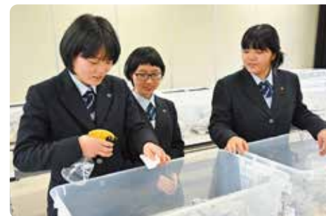
内阁总理大臣奖获奖学校的活动