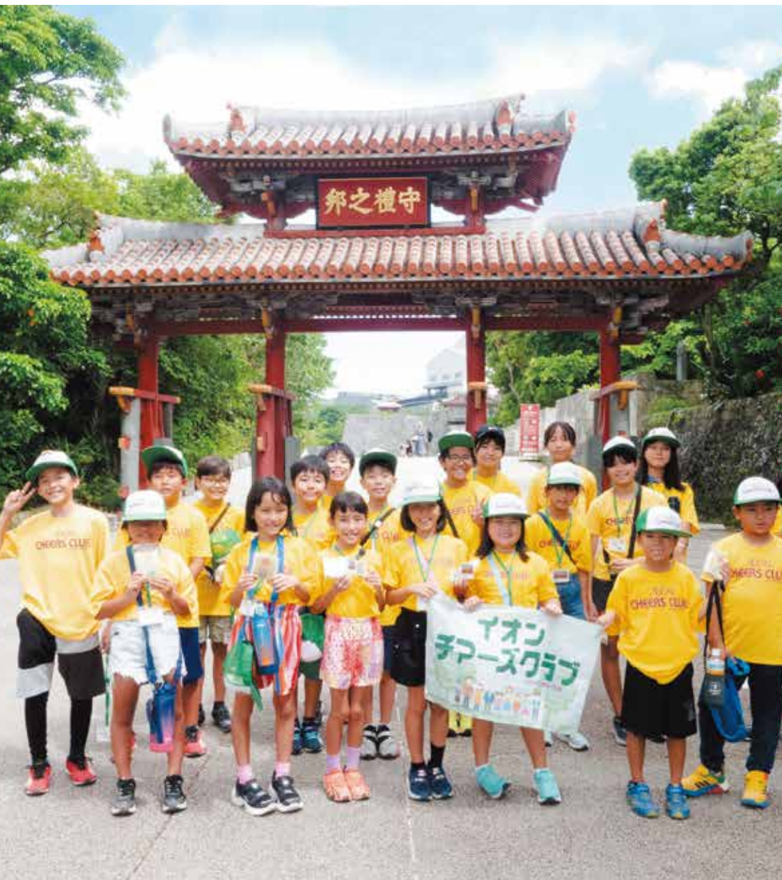
永旺奇乐思俱乐部成员在首里城公园的守礼门合影留念