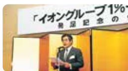
1990年“永旺集团1%俱乐部”成立