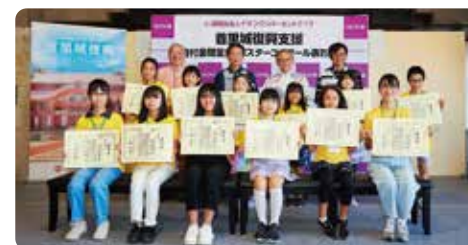
“援助首里城重建海报大赛2023”颁奖典礼