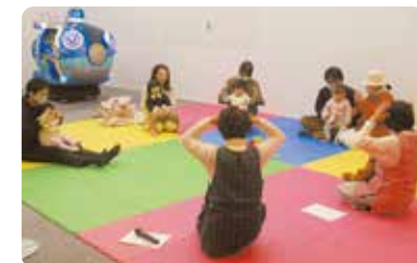
亲子互动手指游戏