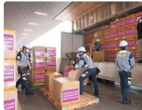
将救援物资装载到卡车上运输