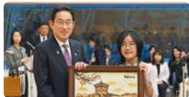
在2023年度日本交流项目中，拜会岸田首相