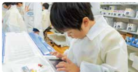
儿童药师职业体验(奇乐思俱乐部WELCIA静岡)