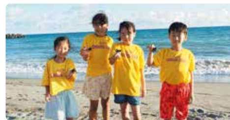
观察海龟(奇乐思俱乐部滨松西)