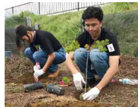
奖学生参与植树志愿者活动(宫城县石卷市)