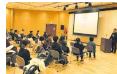
由讲师主讲的育儿研讨会

永旺宝宝健康成长研讨会以促进地区社会的可持续发展为目标，由具有丰富育儿知识的讲师面向0岁到3岁的婴幼儿、学前儿童及其家人举办研讨会和咨询座谈会等，为地区的育儿家庭提供援助。