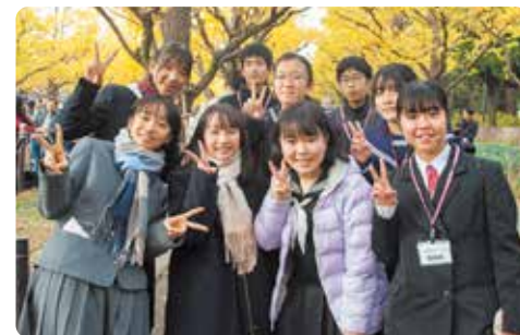
颁奖典礼后参加两天一夜的环保生态之旅