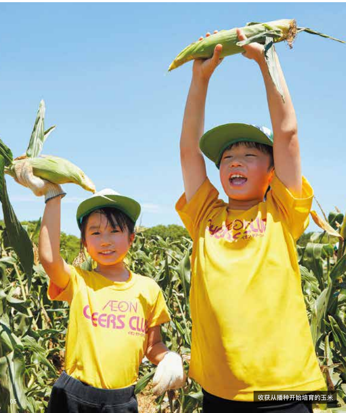
收获从播种开始培育的玉米