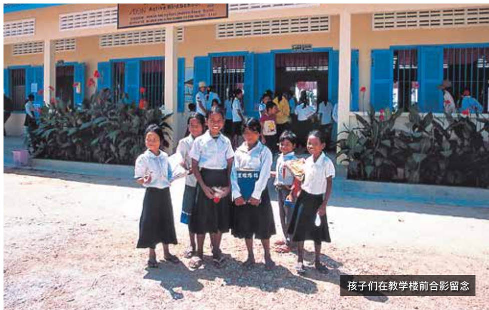
孩子们在教学楼前合影留念