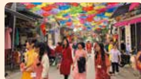
身着传统服饰漫步，体验民族文化