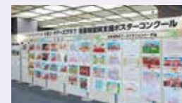
展示包括获奖作品在内的共49件作品

永旺奇乐思俱乐部援助首里城重建海报大赛，旨在让孩子们通过描绘“首里城”支持重建工作的同时了解首里城这个历史悠久的文化遗产。大赛与捐赠仪式和颁奖典礼同时举行，总计收到了来自日本全国各地465件想象力丰富、色彩艳丽的佳作，在颁奖典礼会场展示了包括获奖作品在内的共49件作品。