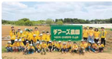
奇乐思农园开园式(茨城县牛久市)