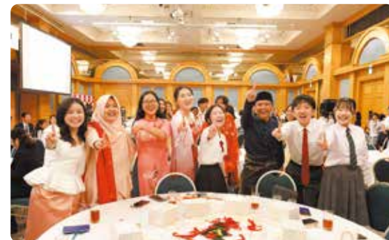
在成果发表会上获得第一名的团队