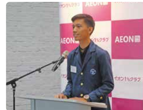
奖学生在印度尼西亚证书颁发仪式上发表演讲