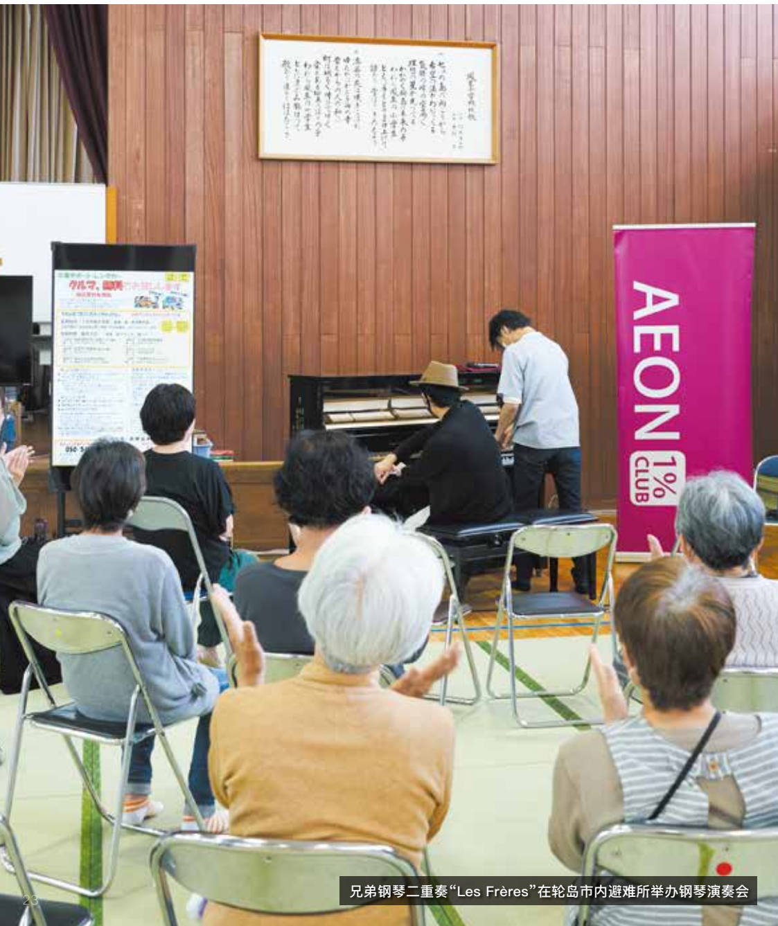
兄弟钢琴二重奏“Les Frères”在轮岛市内避难所举办钢琴演奏会