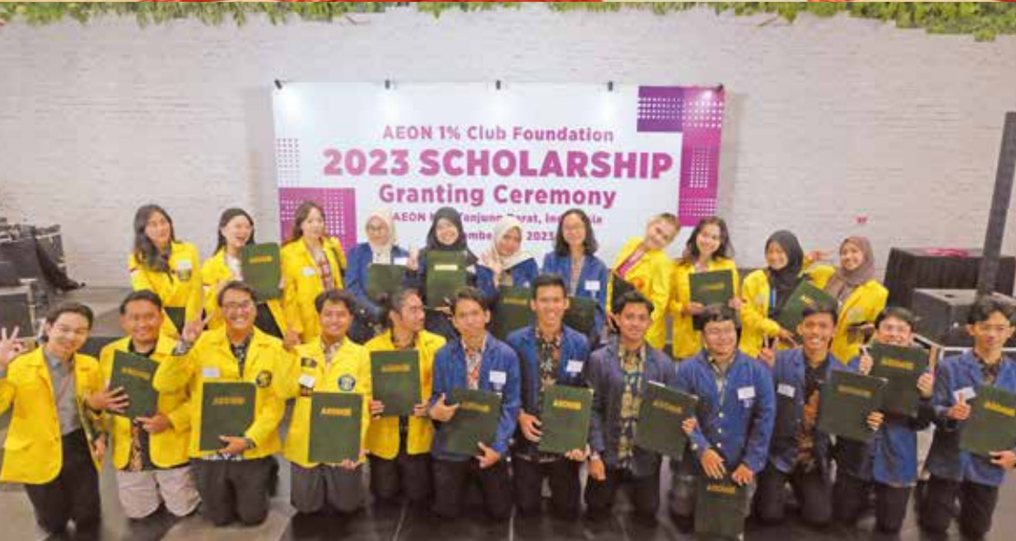
印度尼西亚奖学生在证书颁发仪式上合影留念