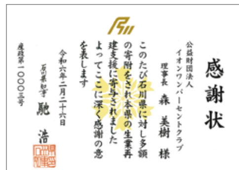
来自石川县的感谢状