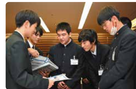
在交流会上就彼此的活动交换意见