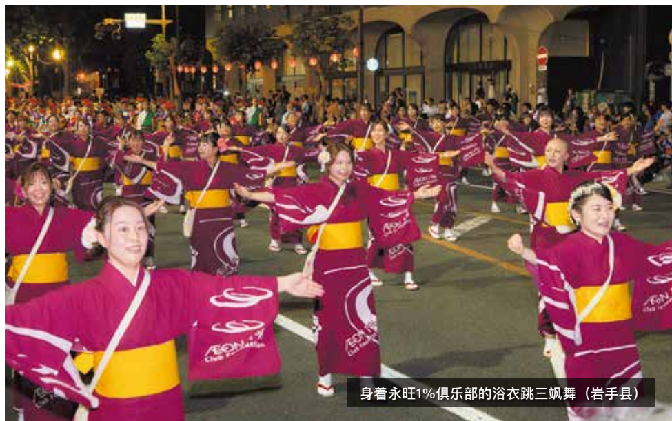
身着永旺1%俱乐部的浴衣跳三飒舞（岩手县）