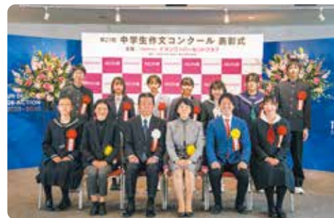
评委和获奖者在颁奖典礼上合影留念