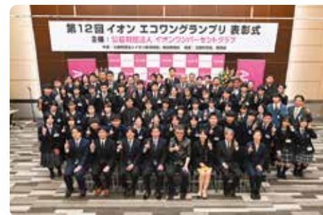
与评委一起在颁奖仪式上合影留念