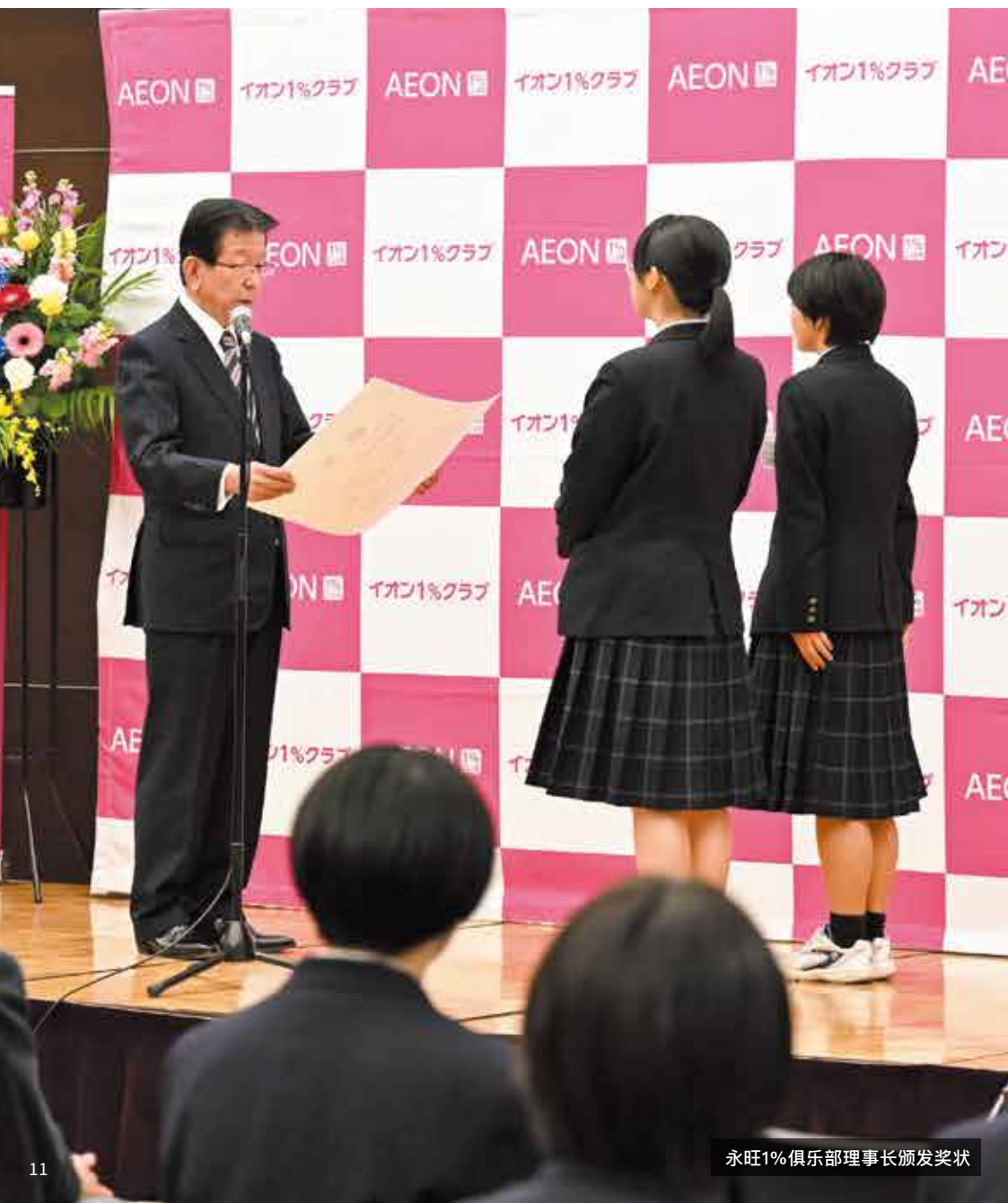
永旺1%俱乐部理事长颁发奖状