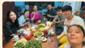
与越南寄宿家庭围坐在餐桌旁