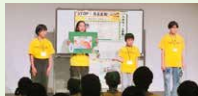
北海道地区第1名俱乐部成员的发表

为了锻炼整理和传达信息的能力，我们每年度末会举办“墙报评审会”，让孩子们在模造纸汇总发表一年的活动成果。发表凝聚了孩子们平时的努力成果以及各种创意。2023年度，我们邀请了外部评委，在全国12个地区举办了最终评审会。