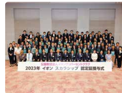
在日本的大学留学的奖学生和嘉宾合影留念