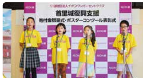
在颁奖典礼上为冲绳县助威呐喊