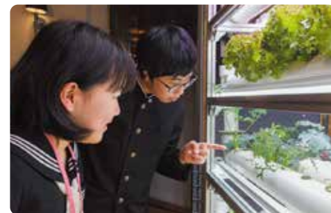
在环保生态之旅中，观察完全人造光栽培的蔬菜