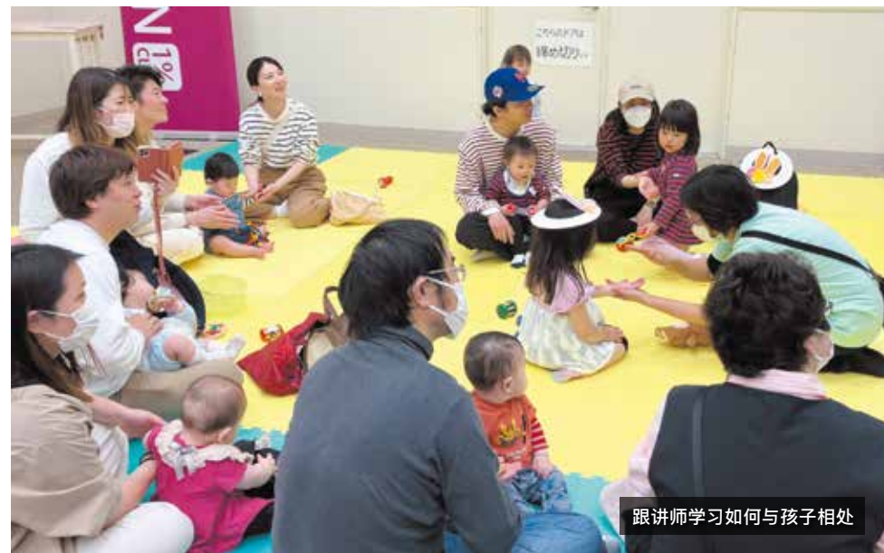
跟讲师学习如何与孩子相处