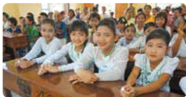
孩子们在新建的校舍中学习

迄今为止，我们利用来自全国各地的募款和永旺1%俱乐部的捐款，在柬埔寨、尼泊尔、越南、缅甸以及老挝共计援建了426所学校。除了建设学校及完善供水设施、提供学习用品外，我们在教师培养等方面也提供了无形的援助。