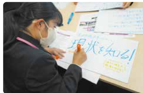
在环保生态之旅中，讨论为保护环境能做什么