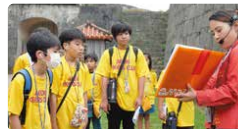
参观首里城公园学习历史