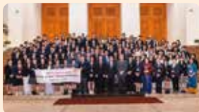
礼节性拜访越南首相府