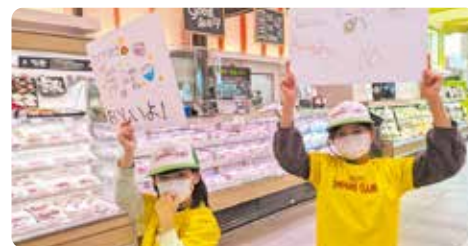
销售从幼苗培育的大米(奇乐思俱乐部KASUMI筑波)