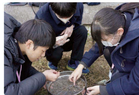
在环保生态之旅中观察微塑料