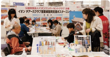
首里城复兴祈愿展现场