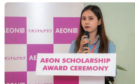
关于未来梦想的演讲（柬埔寨会场）