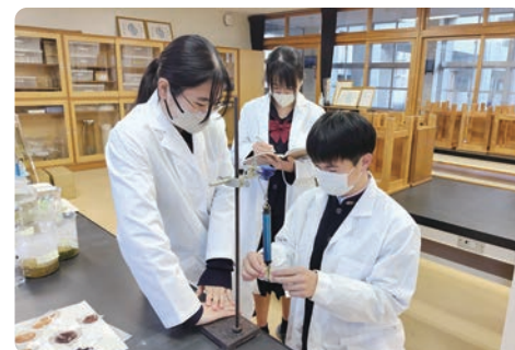
内阁总理大臣奖(研究、专业类)获奖学校的活动