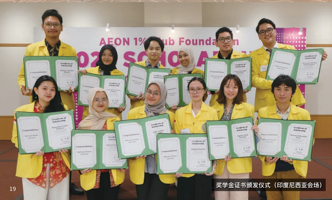
奖学金证书颁发仪式（印度尼西亚会场）

自2006年起实施的永旺奖学金是为亚洲大学生提供的奖学金，希望他们未来在日本与祖国之间架起友好的桥梁。永旺奖学金在日本国内向奖学生提供奖学金的同时也举办奖学生之间的交流会和住宿研讨会以及参加志愿者活动等机会。在日本以外的国家，对于在印度尼西亚、柬埔寨、泰国、中国、越南、缅甸的大学就读的当地奖学生，我们每年都会在各国家举办证书颁发仪式，为奖学生们提供了跨校交流和参加日语演讲比赛等的机会。