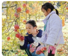
通过苹果采摘体验，学习当地产业（群馬县水上町）