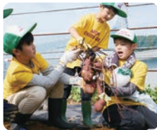
收获从幼苗开始培养的红薯（宫城县仙台市）