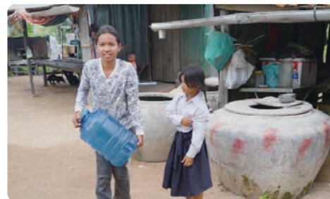
为了获得安全用水，每天都要去远方打4~5次水的姐妹