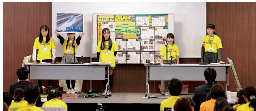
桥本永旺奇乐思俱乐部发表墙报的情景

通过各地区预选赛的俱乐部在日本全国被分成13个赛区并进入最终评审会。来自株式会社朝日学生新闻社和各地政府的人士担任评委，对墙报完成度和发表内容进行评估。获奖俱乐部将分别参加8月份在关东和北海道两个会场举行的全国大赛。