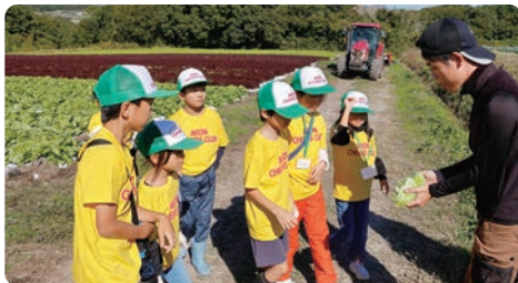
听取有关生菜种类和收获方法的讲解