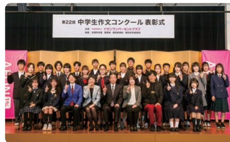
评委和获奖者在颁奖典礼上合影留念