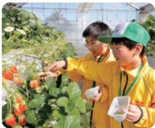
采摘自己定植幼苗和授粉的草莓（埼玉县越谷市）