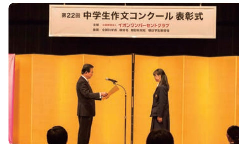
自2024年度起新设文部科学大臣奖