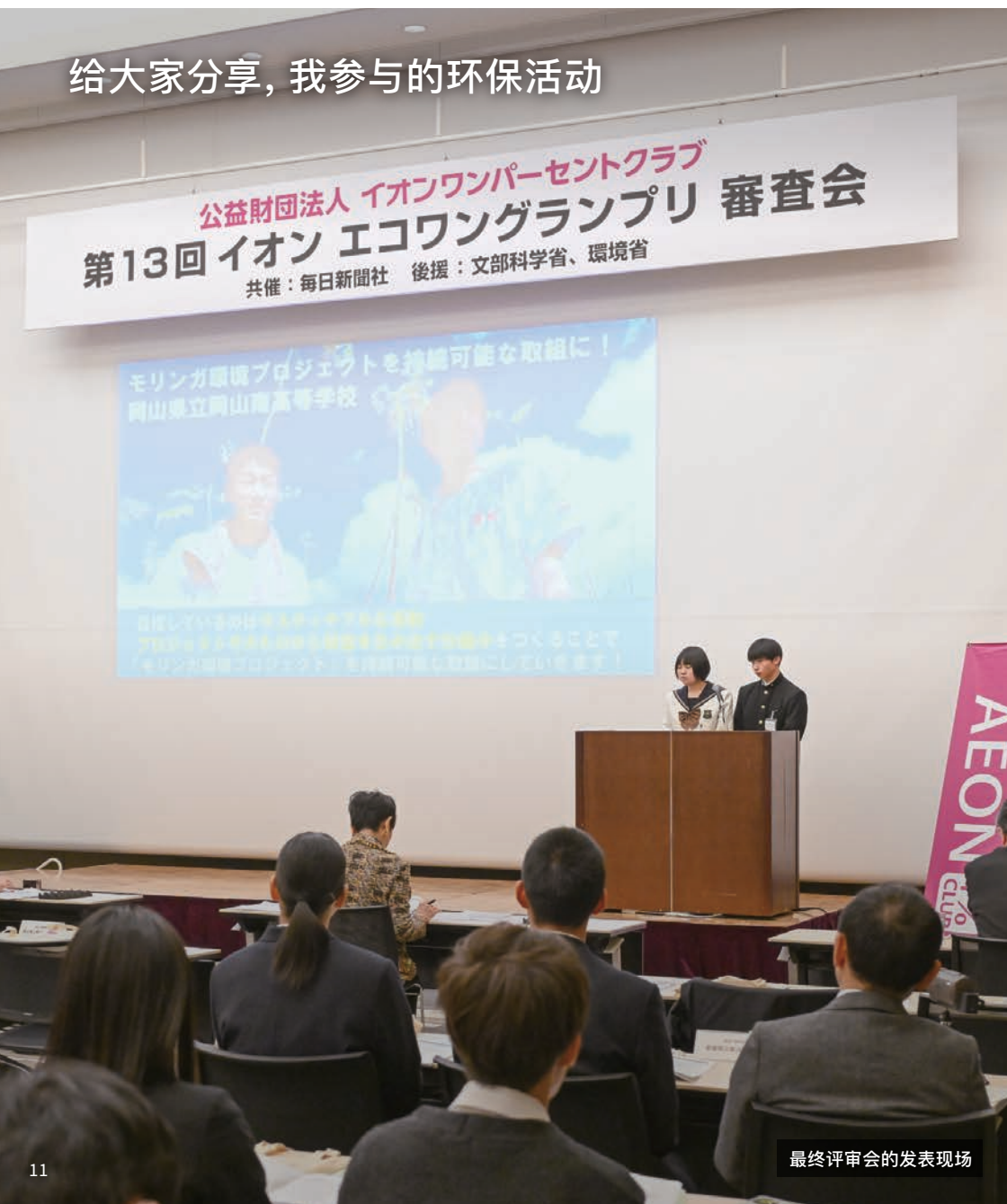
最终评审会的发表现场

永旺eco-1大赛是关心地球未来的高中生们展示环保和社会贡献活动的竞赛。该大赛自2012年开始举办,旨在通过聆听其他学校的发表来得到新的活动灵感,并提高表达和宣传能力。在2024年度第13届永旺eco-1大赛上,经过二轮评审脱颖而出的12所学校的学生齐聚东京,参加了最终评审会。他们利用照片和视频介绍了自己平日的努力,并在评委提问时从容作答,充分展示了自己的活动成果。