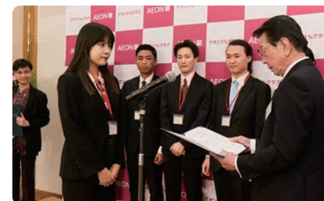
证书颁发仪式（日本国内会场）