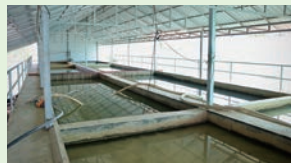
净水设施的建造和维护等