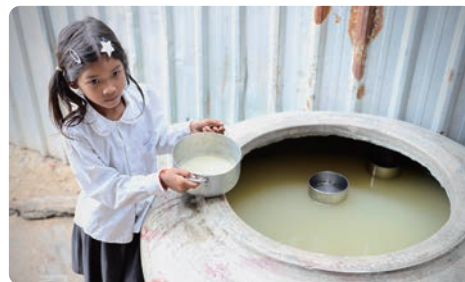
人口稀少地区的家庭无法获得安全管理的水源