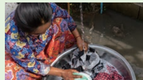
为人口稀少地区家庭铺设管道和供水