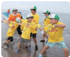
齐心协力体验拉网捕鱼（千叶县富津市）