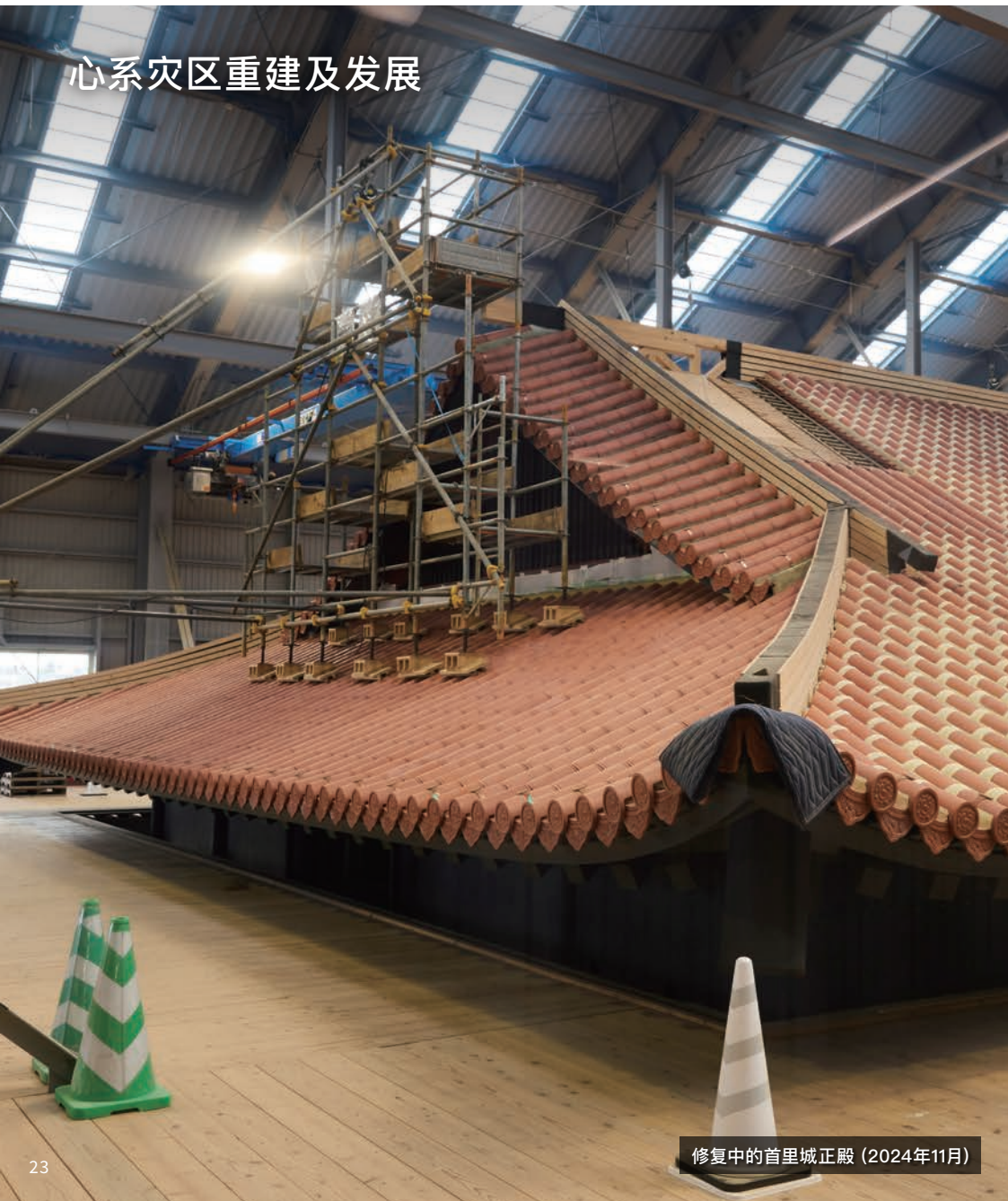
修复中的首里城正殿（2024年11月）

援助灾害重建项目为帮助因国内外灾害而受灾的人们早日恢复正常生活，除了在发生灾害时迅速提供援助款和救援物资外，还持续开展对灾区重建和复兴的援助活动。 截至2024年度，通过首里城复兴援助活动为在2019年10月火灾中严重损毁的世界遗产首里城，捐赠了5亿1千万日元。