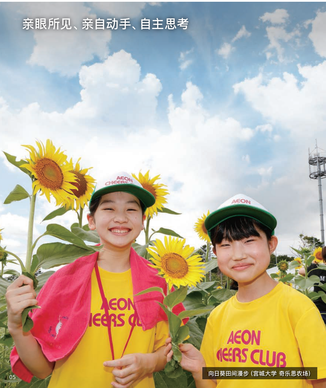
向日葵田间漫步（宫城大学 奇乐思农场）

永旺奇乐思俱乐部主要面向小学生，致力于培养学生们对环境和社会贡献活动的兴趣和自主思考能力。永旺奇乐思俱乐部以日本全国永旺集团旗下的店铺等为据点，开展有关“环境、社会”的体验式学习。2024年度，448家俱乐部分别开展了动植物调查等多种多样的体验活动。