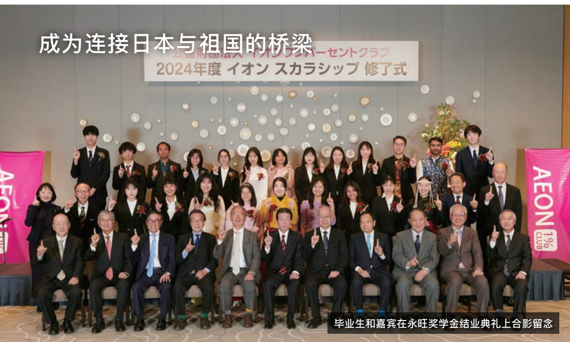
毕业生和嘉宾在永旺奖学金结业典礼上合影留念

公益財団法人 イオンワンパーセントクラブ 2024年度 イオン スカラシップ 修了式