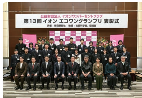
评委、嘉宾和获奖者在颁奖典礼上合影留念