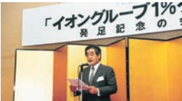
1990年“永旺集团1%俱乐部”成立

自1990年成立以来在社会各界人士的支持下， 已经走过30多年的历程。 向着充满笑容的未来，我们今后将继续前行。