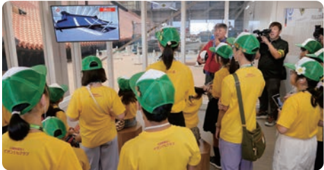
永旺奇乐思俱乐部成员参观首里城修复情况

万众一心，祈盼首里城复兴。永旺奇乐思俱乐部举办了援助首里城重建海报大赛，并在全国10个地方举办“首里城复兴祈愿展”，以展板等宣传复兴情况，持续开展支援活动为2026年首里城正殿竣工助力。