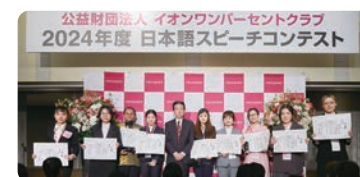
向获奖者颁发奖状和纪念品

日语演讲比赛是学习日语的亚洲大学生，就某一主题用日语发表自己观点的比赛。通过与其他大学生同场竞技，为大学生们提供了接受新鲜事物和切磋琢磨的机会。2025年2月，以“我们现在能为地球环境做的事情”为主题，在各国经评审后，从277名报名者中脱颖而出的50名优胜者来到日本，参与最终评审会。