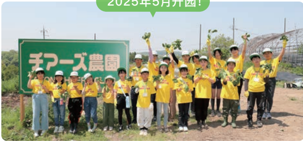
三木里胁奇乐思农园（兵库县三木市）