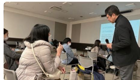
讲师主持的育儿研讨会