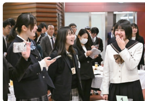
在交流会上与其他学校学生和评委们交流