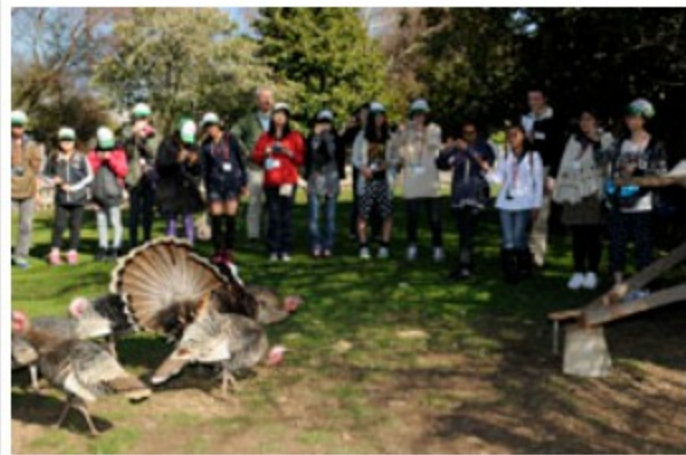
タスマニアにいる鳥の羽の美しさに驚く子供たち