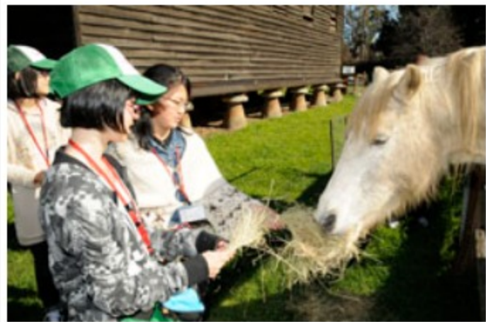
白馬に干し草を与える子供たち