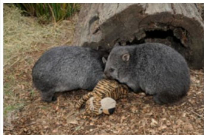
タスマニア固有の有袋類ウォンバットを発見