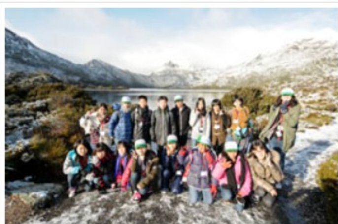
天候に恵まれ、山頂の前で記念撮影する子供たち