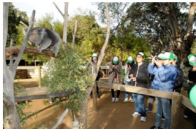
コアラの可愛い仕草に思わずシャッターを押す子供たち