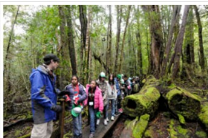
「クレイドルマウンテン」国立公園の森を視察する子供たち