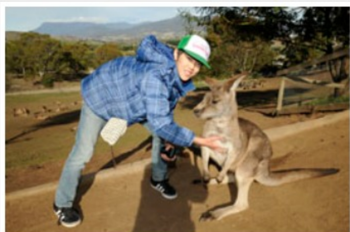
記念撮影にはカンガルーもこのポーズ