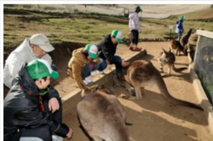
カンガルーと触れ合いエサをやる子供たち