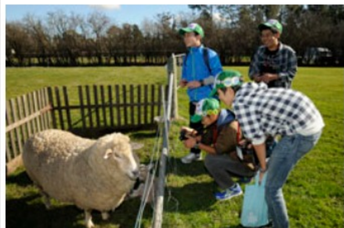
ひつじに興味深々の子供たち