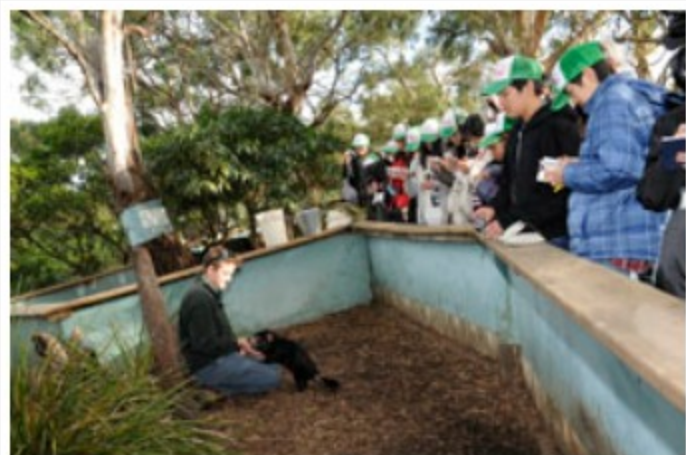
タスマニアデビルの特徴を学習