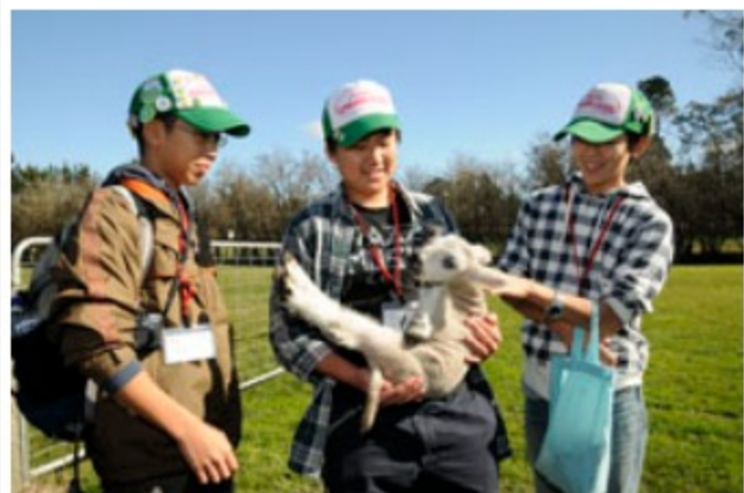
赤ちゃんひつじと触れ合い思わず笑顔がこぼれる子供たち