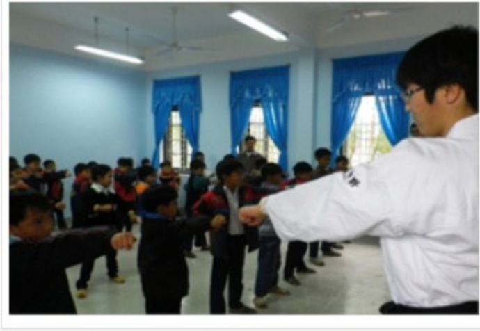
ベトナムの子どもたちに空手を教える日本人参加者