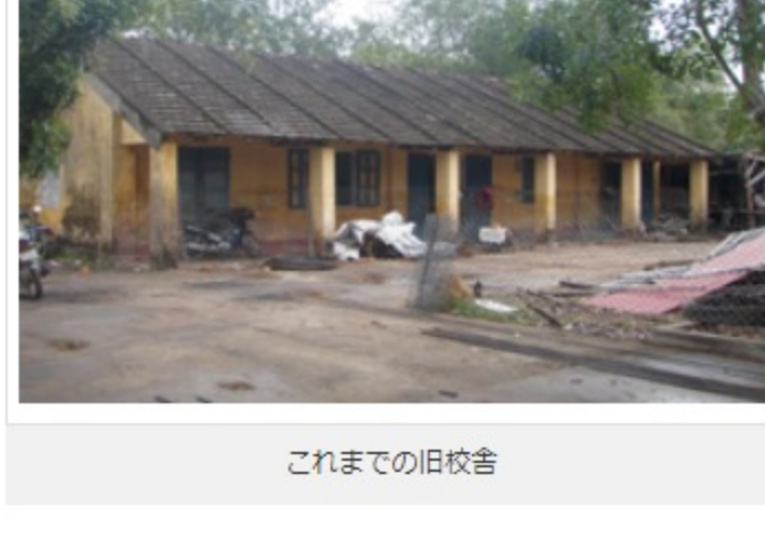
これまでの旧校舎