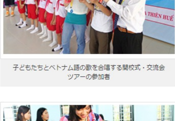
ベトナムの子どもたちと紙風船で遊ぶ開校式・交流会ツアーの参加者