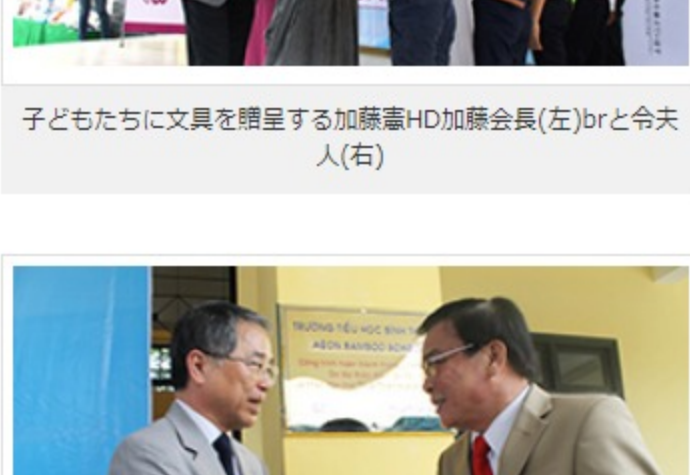
除幕式を終え握手するイオン1%クラブ林委員長とフエ省人民委員会委員長代理ホア副委員長