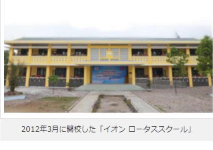
2012年3月に開校した「イオン ロータスクール」