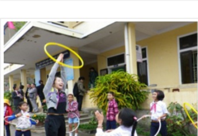
新体操コーナーではイオン新体操メンバーが指導