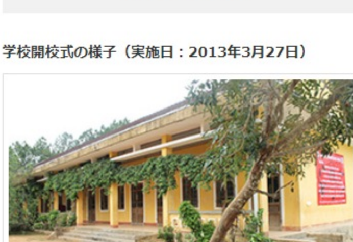
旧校舎(Binh Than Primary School)