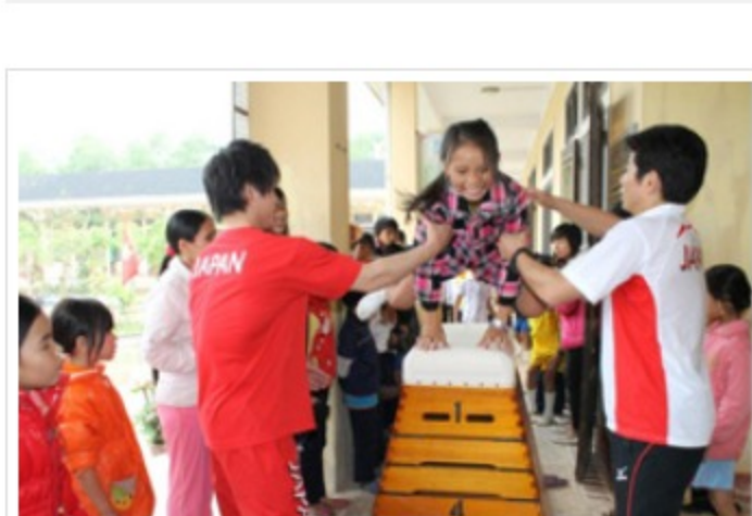
体操コーナーではオリンピック金メダリスト 富田選手が指導