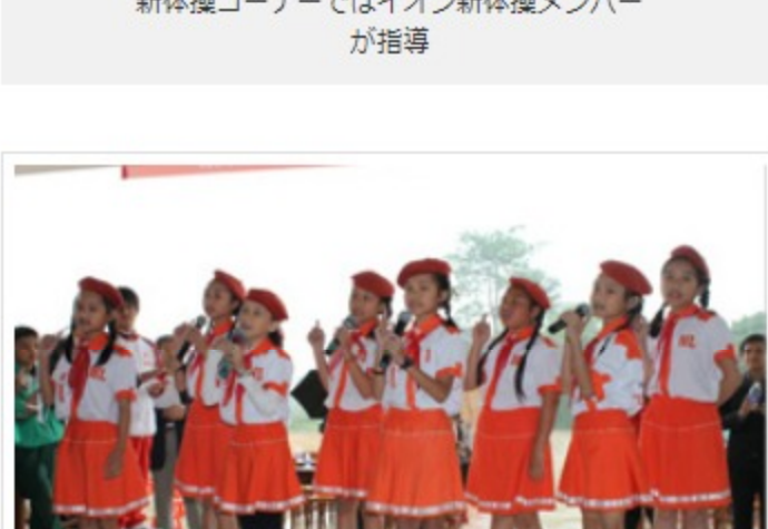
日本の歌「赤とんぼ」を歌う、ベトナムの子どもたち