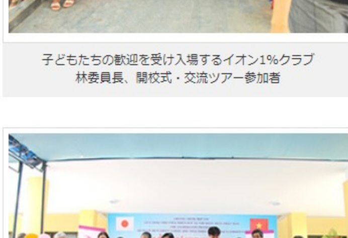
オープニングセレモニーでのテープカット