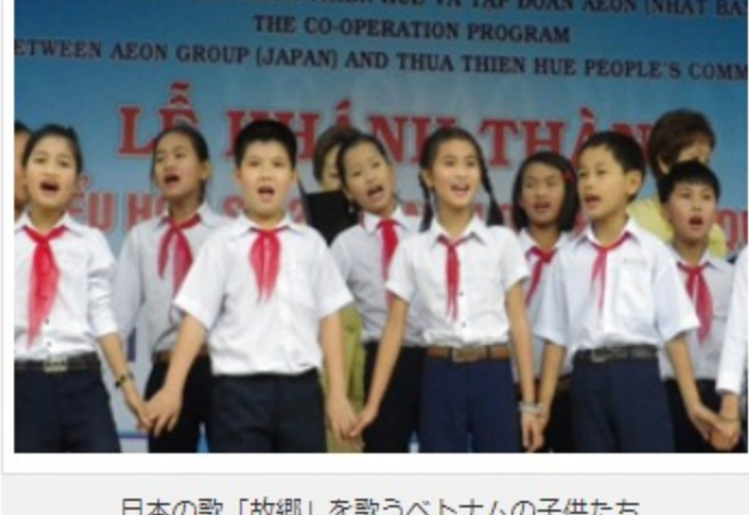
日本の歌「故郷」を歌うベトナムの子供たち