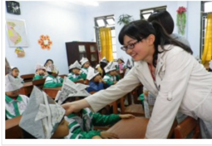
ベトナムの子どもたちに日本の伝統遊び、かぶとづくりを教える日本人参加者