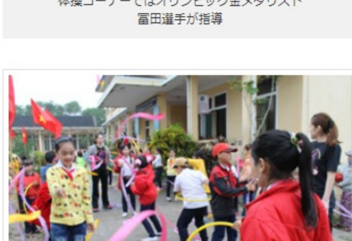
ベトナムの小学生としゃぼん玉遊びで交流する日本人参加者