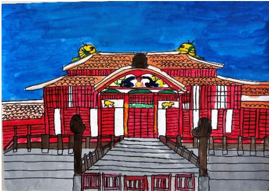
茨城県 イオン チアーズクラブ 土浦 (小4)