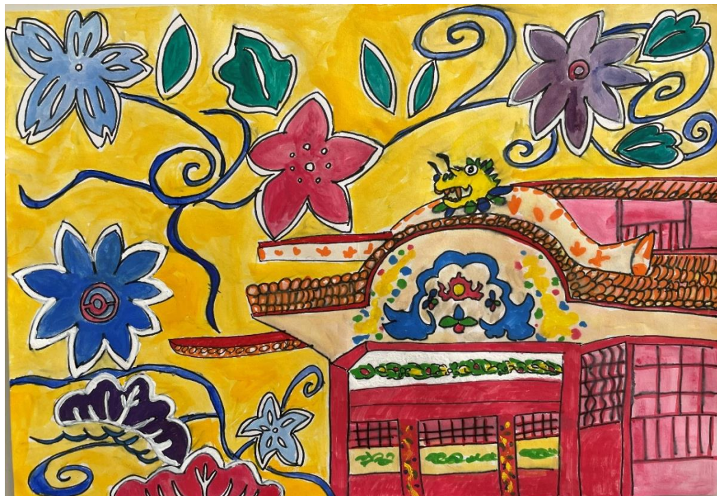
【最優秀作品】 愛媛県 イオン チアーズクラブ 新居浜 (小3)

公益財団法人イオンワンパーセントクラブは、2019年10月31日未明に発生した火災で首里城が甚大な被害を受けたことにより、次代に継承する文化的資産の復元を継続的に支援したいとの思いから、同年、「イオン首里城復興支援プロジェクト」の一環として、向こう5年間で5億円の支援を表明し、間もなく3年となります。首里城正殿復元整備工事起工式に先立ち、10月31日(月)、復興支援金1億円を沖縄県に寄付します。