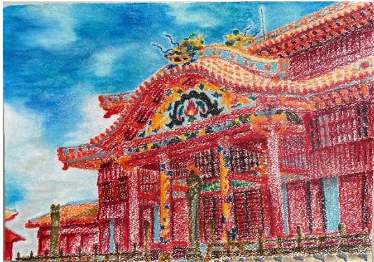
石川県 イオン チアーズクラブ 白山 (小3)