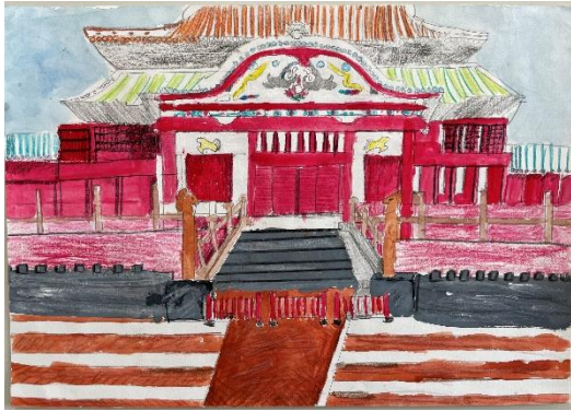
北海道 イオン チアーズクラブ 旭川駅前 (小5)