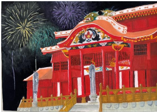
三重県 イオン チアーズクラブ 桑名 (中1)