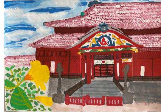
東京都 イオン チアーズクラブ 御嶽山駅前 (小5)