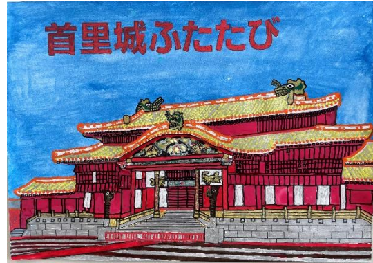
宮城県 イオン チアーズクラブ 仙台 (小4)