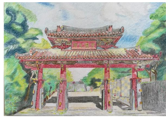
大阪府 イオン チアーズクラブ 日根野 (中2)