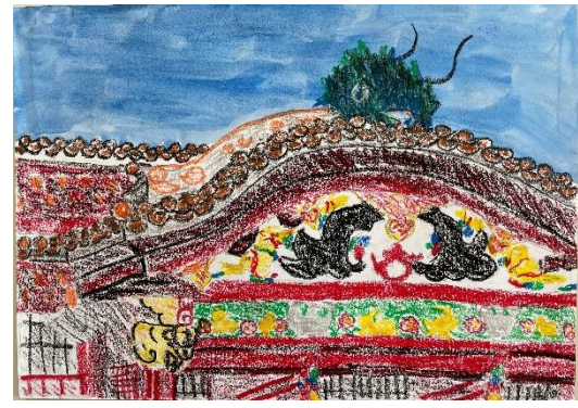
静岡県 イオン チアーズクラブ 裾野 (小6)